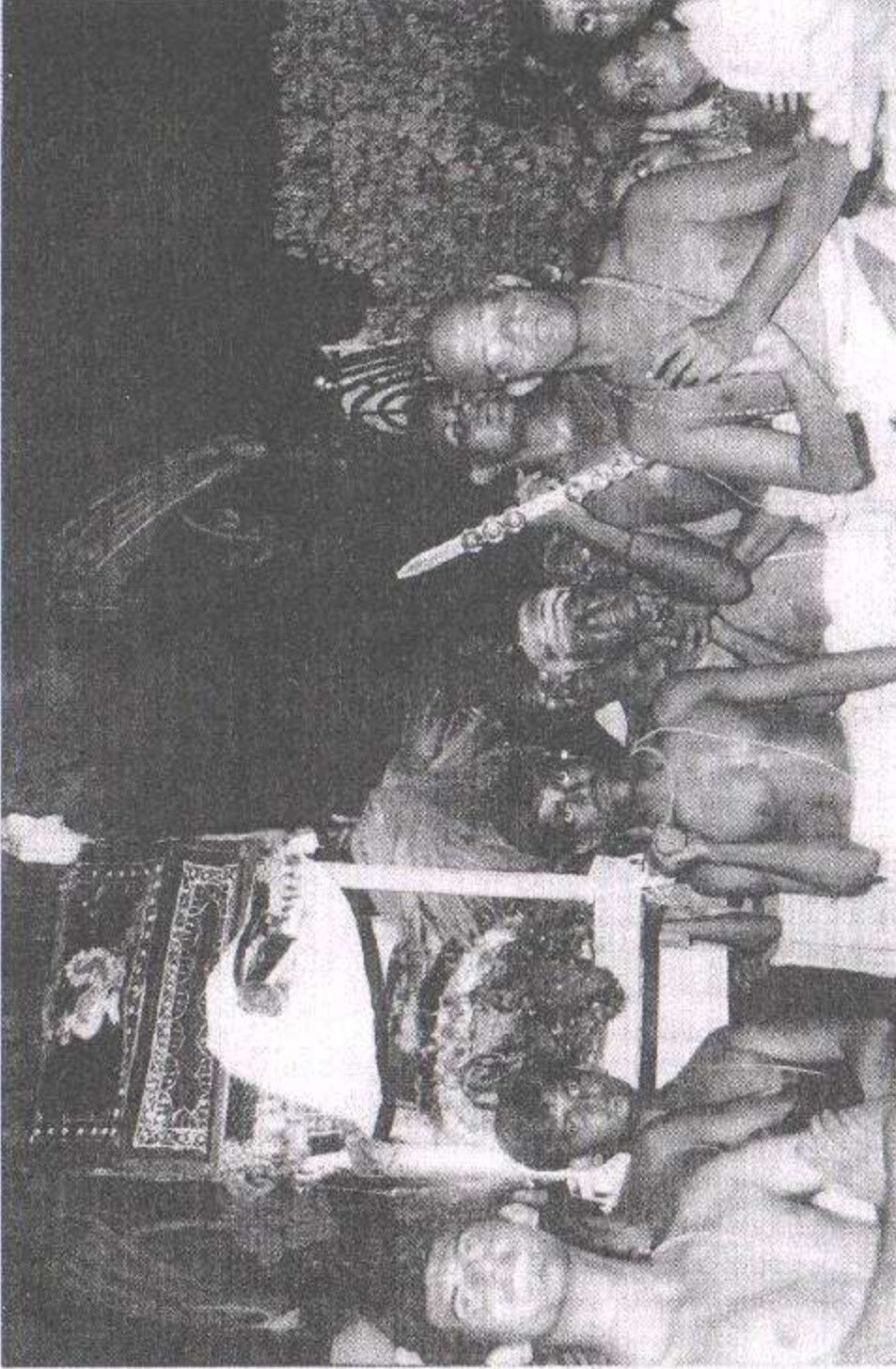
மதுரபுரி ஆஸ்ரமத்தில், ப்ரஹ்மோத்ஸவத்தின் பொழுது பெருமாள் புறப்பாடு சென்று ஆஸ்ரமத்திற்கு திரும்பி வரும் காட்சி